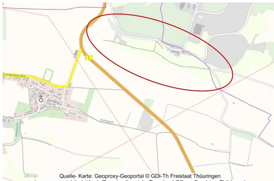
Darstellung ohne Maßstab