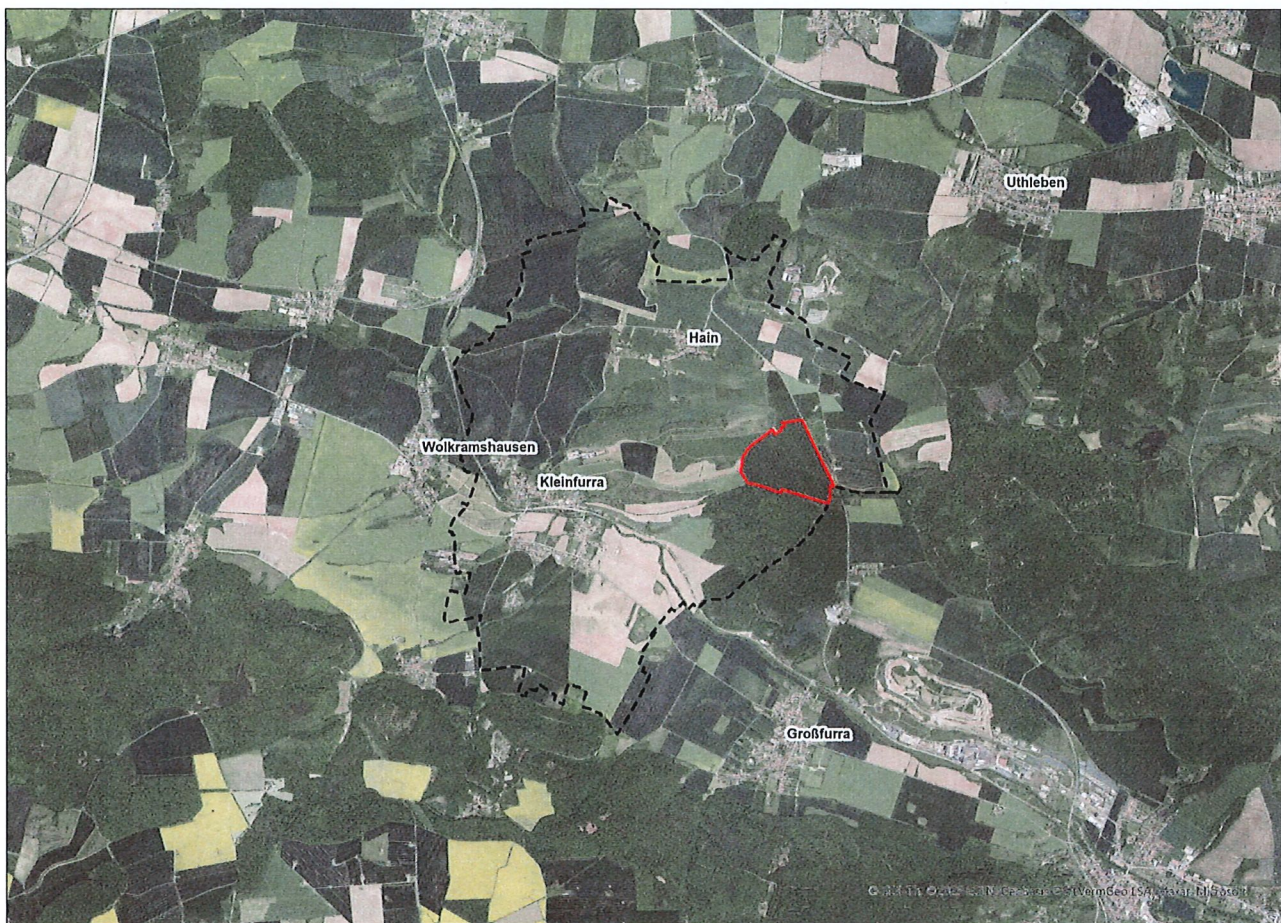
Abbildung 1: Übersichtsplan zur Verortung des Geltungsbereichs im Gemeindegebiet Kleinfurra

Bebauungsplan Nr. 4 „PV-Freiflächenanlage Kleinfurra/Hain“ der Gemeinde Kleinfurra