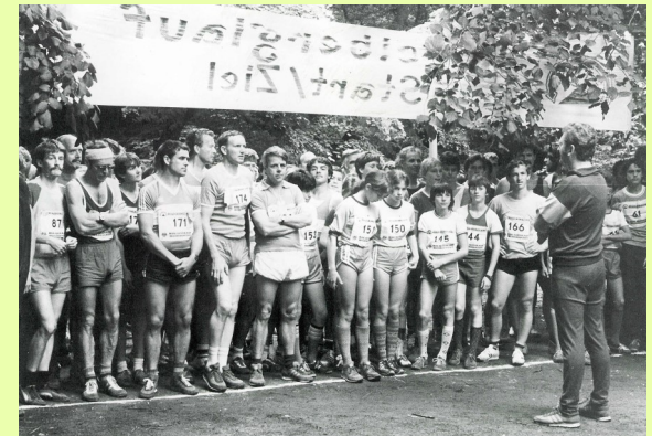
4. Lauf 1985