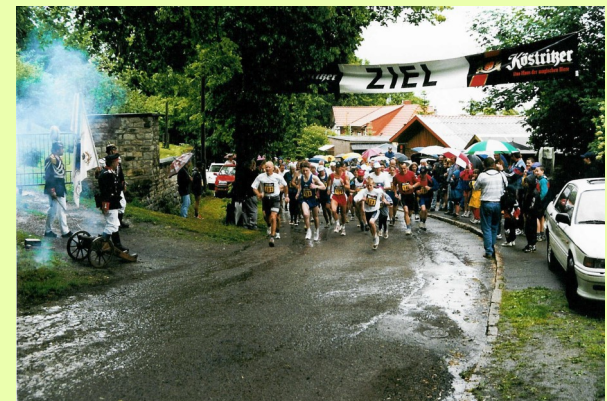
18. Lauf 1999